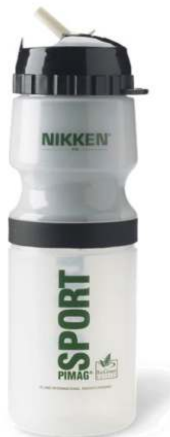
Всегда наличие так же: Фильтр Pimag Waterfall

Заказать фильтр бутылку Pimag вы можете на сайте http://nikkenrus.com/